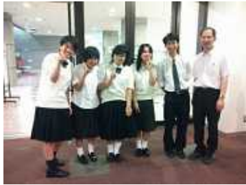
ボランティアありあけ新世高校の生徒さん